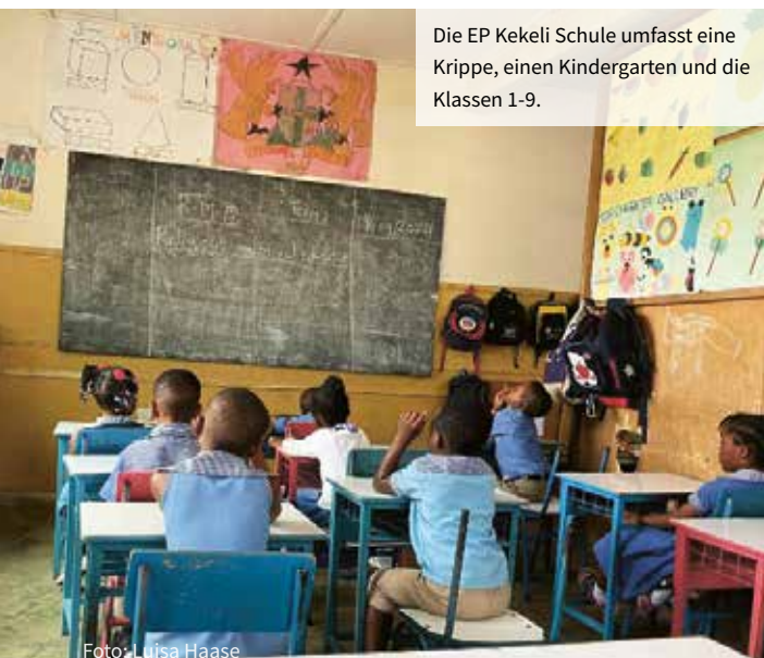
Die EP Kekeli Schule umfasst eine Krippe, einen Kindergarten und die Klassen 1-9.

Unser ghanaisches Schulsystem ist mehr oder weniger gut. Es kommt auf jede Schule individuell an. Allerdings denken wir als Lehrerinnen und Lehrer generell, dass wir die Begabungen der einzelnen Schülerinnen und Schüler mehr fördern sollten. Wir sollten diese mehr in den Unterricht integrieren. Unter den Kindern sind zum Beispiel viele begabte Künstler oder Ingenieurinnen. Wir dürfen diese Fähigkeiten nicht übergehen und sollten sie wertschätzen!