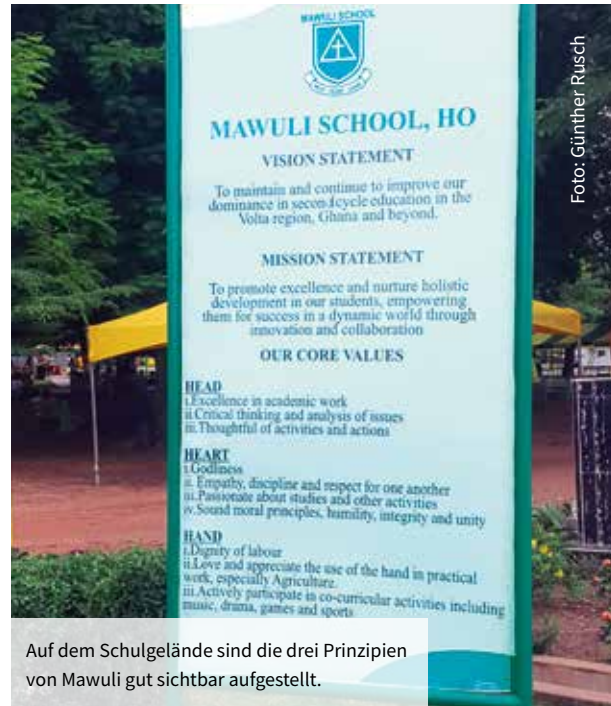
Auf dem Schulgelände sind die drei Prinzipien von Mawuli gut sichtbar aufgestellt.

Die Jubiläumswoche war ein richtiges Freudenfest. Jung und Alt hatten viele Gelegenheiten, sich auszutauschen oder ihre Fähigkeiten zu zeigen. Gelegentlich hatten die Begegnungen den Charakter von einem überdimensionalen Klassentreffen, auf dem geplaudert, gelacht wurde, aber auch Wehmut über den Verlust von früheren Mitschüler:innen aufkam. Besonders eindrucksvoll war ein Tag, als Hunderte, wenn nicht tausend