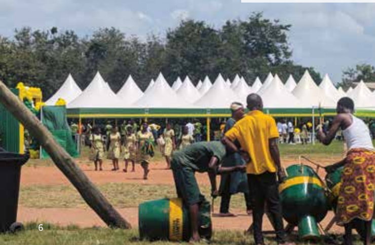
Das Festgelände wird für die Jubiläumsfeier vorbereitet.