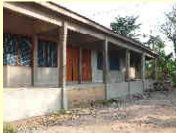
■ Kindergarten in Akome / Ghana