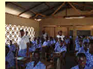
■ Partnerschaft Tatalé - Brinkum