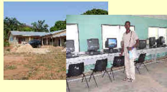
■ Berufliches Ausbildungszentrum in Alavanyo / Ghana