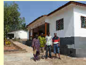
■ Gesundheitsstation in Sodo / Togo