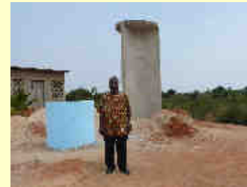
■ Brunnen in Kohe/Togo