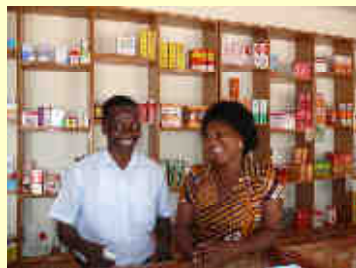
■ Apotheke in Ho / Ghana