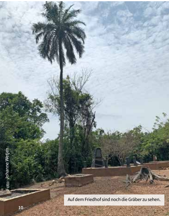
Auf dem Friedhof sind noch die Gräber zu sehen.

Umso wichtiger ist es meiner Meinung nach, dass neben den noch sichtbaren Spuren der Deutschen heute Hinweistafeln in drei verschiedenen Sprachen Passanten informieren. So werden einem auch die Schattenseiten, die der Kolonialismus mit sich bringt, wieder ins Gedächtnis gerufen. Ganz egal, wer diese Kolonialisten waren.