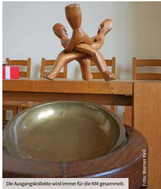
Die Ausgangskollekte wird immer für die NM gesammelt.

In den vergangenen 25 Jahren haben wir immer wieder auch Berichte mit Fotos und anderen Eindrücken aus den Projekten erhalten, aus der NM-Geschäftsstelle in Bremen oder von Gästen, die wir in unserer Gemeinde begrüßen durften. Für Gemüseanbau, Apotheken oder Schulbänke in Ghana und Togo sind in 25 Jahren fast 45.000 Euro zusammengekommen. Inzwischen liegt die jährliche Kollektensumme bei gut 2500 Euro. So ist aber auch in den Jahren ein Verständnis entstanden, dass die Norddeutsche Mission auch UNSERE