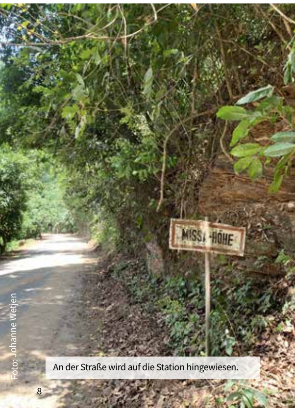
An der Straße wird auf die Station hingewiesen.

Die Station war strategisch gut gelegen. Sie sicherte den Deutschen Zugang zu den zuvor schwer erreichbaren Gebieten in den Bergen und förderte somit den deutschen Handel. Doch vor allem die kolonialpolitische Bedeutung, die von dem Bau der Station ausging, schien den Deutschen von Vorteil zu sein. Misahöhe lag in einem damals umstrittenen Gebiet zwischen Großbritannien und Deutschland. Jetzt, wo die Deutschen eine Station am einzigen über die Togogebirgskette führenden Pass gebaut hatten, bekräftigten die Deutschen ihren kolonia-