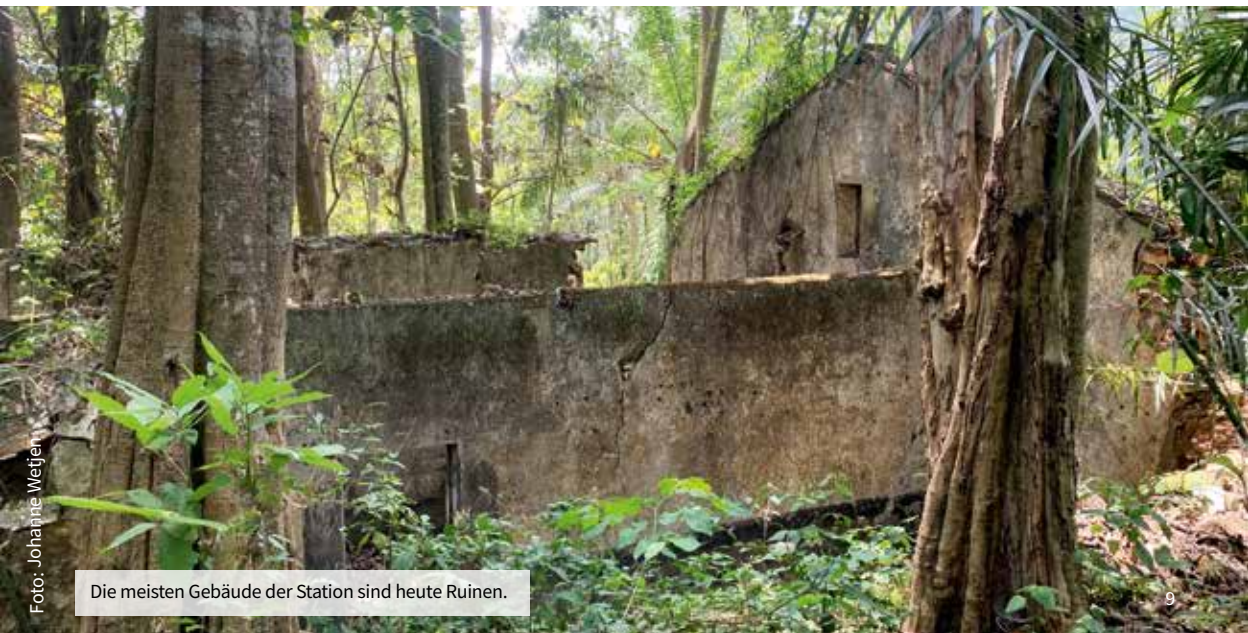
Die meisten Gebäude der Station sind heute Ruinen.

Die Spuren der zweiten Bahn, der „Kaffee- und Kakaobahn“, sind in Kpalimé noch gut zu erkennen. Feierlich eröffnet wurde die 119 km lange Bahnstrecke am 27. Januar 1907 zum Geburtstag Kaiser Wilhelms II.. Auch sie sollte den Handelsweg von Kpalimé nach Lomé für Agrargüter vereinfachen wie Kakao, Ölpalmen und Kaffee, die in der Region in großen Mengen geerntet wurden. Auch einige Waggon für den Personenverkehr kamen zum Einsatz. Am Ende der deutschen Kolonialzeit gab es in Togo insgesamt eine Schienenstrecke von 327 km.