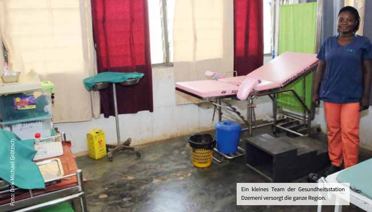
Ein kleines Team der Gesundheitsstation Dzemeni versorgt die ganze Region.